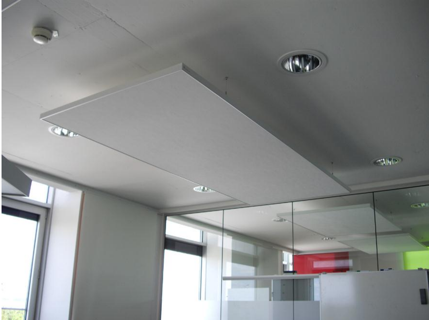
Die Sonatech-Schallschutzelemente fügen sich harmonisch in die Raumgestaltung ein