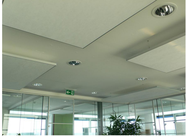
Schöne Optik und bessere Akustik, dies sind nur zwei Vorteile der neuen Schallschutzelemente

Anhand der vor Ort durchgeführten Schallmessungen und der zur Verfügung gestellten Grundrisspläne arbeiteten die Sonatech-Mitarbeiter ein Konzept aus, mit dessen Hilfe der Nachhall in den Büroräumen deutlich reduziert wurde. Dabei kamen die bewährten Sonatech-QuietLine-Akustikelemente zum Einsatz. Sie bestehen aus einem weißen Absorbermaterial, das von einem umlaufenden weißen oder alufarbenen Rahmen eingefasst ist. Dank ihres zurückhaltenden Erscheinungsbildes eignen sich die QuietLine-Akustikelemente besonders für Anwendungsfälle, bei denen auf gute Schallabsorption in Kombination mit ansprechender Optik Wert gelegt wird. Knapp 30 Elemente wurden in den elf Büroräumen eingebaut. Alle sind individuell an die je-