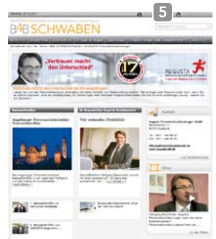
BEISPIEL „B4B PARTNER MICROSITE“