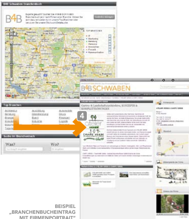
BEISPIEL „BRANCHENBUCH-EINTRAG MIT FIRMENPORTRAIT“